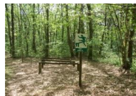
Saut de haies