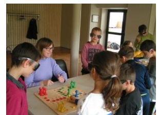
Les enfants découvrent comment vivre avec la cécité