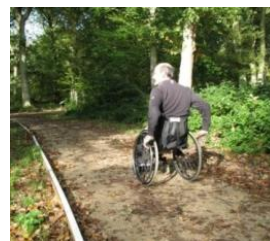
Ligne de vie