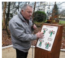
Une signalisation adaptée