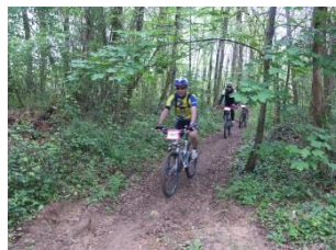
Randonnées V.T.T. de Pâques