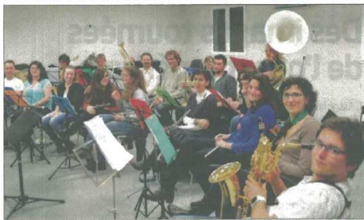
L'Harmonie salembraise partage cette salle annexe toute neuve avec l'association La Clé du temps.