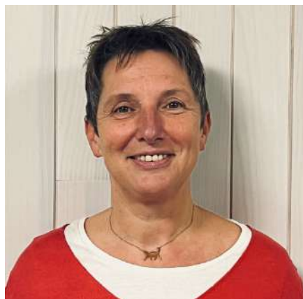
Cheffe de Service